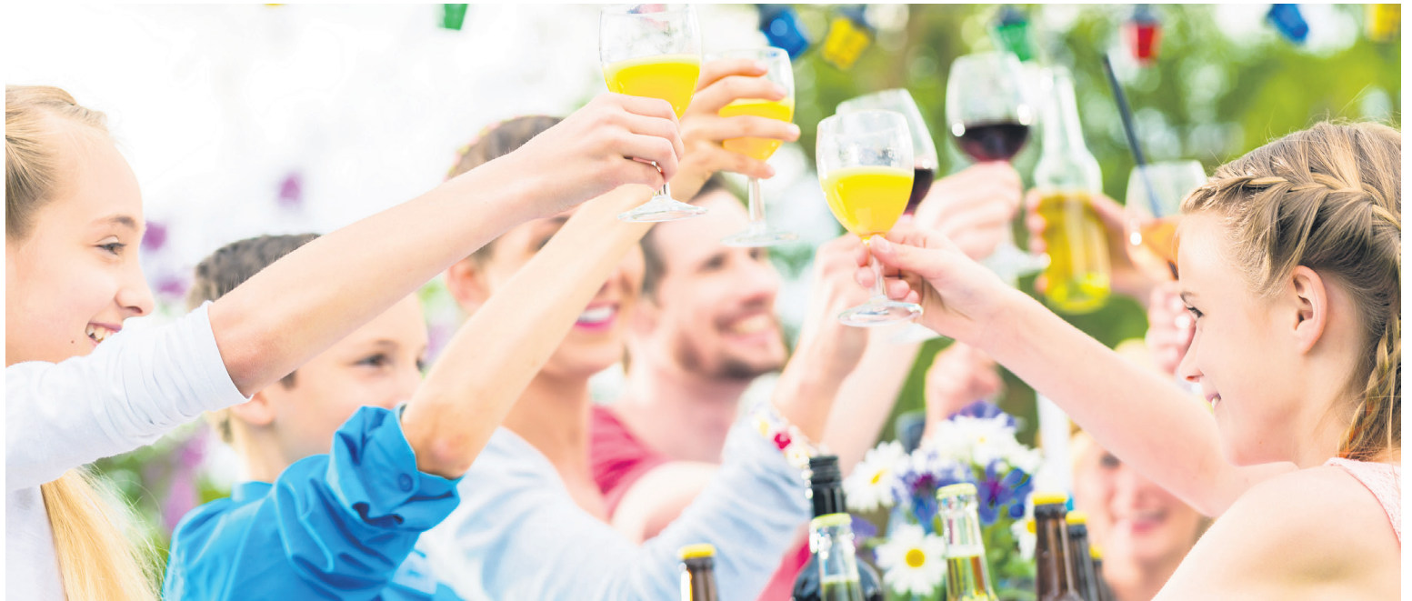
Kennen Sie Ihre Nachbarinnen und Nachbarn schon?

Am 26. Mai feiert die Schweiz den jährlichen Tag der Nachbarschaft. Auch in der Stadt Bern werden die Bewohnenden zum festlichen Zusammensein eingeladen.